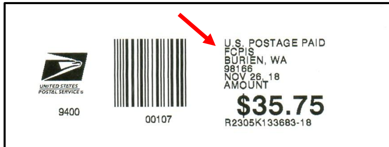
Afbeelding 14: FCPIS

Op een strook van 26 november 2018 trof ik iets nieuws aan. Onder US POSTAGE staat er niet meer PAID ( afbeelding 14 ).