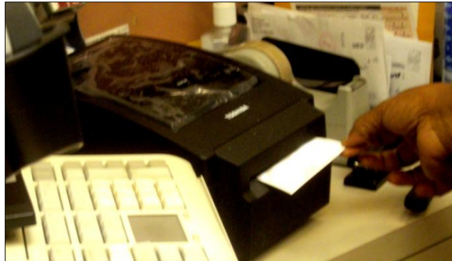
Afbeelding 9: blanco teststrook uit de printer

Ik vroeg de medewerkster of ik uit deze nieuwe machine ook teststroken kon krijgen. Het enige dat als test uit de printer kwam was echter een onbedrukte strook ( afbeelding 9 ).