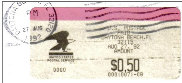
Afbeelding 1: PVI uit 1992

Van 1992 tot 2014 zijn in Amerika de PVI-printers van de firma MOS in bedrijf geweest. PVI staat voor Postage Validation Imprinter = printer voor postale opdruk. Ze worden wel 'the workhorse (= het werkpaard) of the US Postal Service' genoemd. Al die 23 jaar zagen de stroken er hetzelfde uit. Ze waren voorgedrukt met ronde hoeken, ze hadden een roze fosforrand, ze zaten op rollen onderpapier en ze waren zelfklevend ( afbeelding 1 ). Het logo van de Amerikaanse adelaar stond links op de PVI gedrukt.