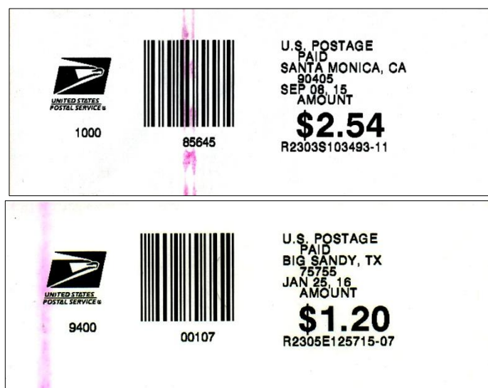
Afbeelding 5: rode eindstreep

Later bleken er op deze stroken ook een rode eindstreep voor te komen (afbeelding 5), die het eind van de strokenrol aankondigt.