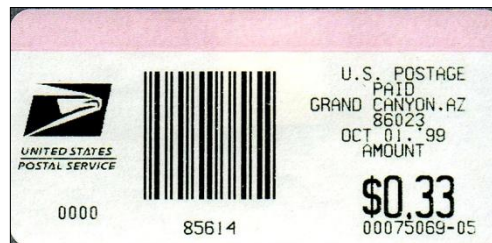
Afbeelding 2: PVI uit 1999

In 1999 was ik in het Grand Canyon National Park en ik ontdekte op de South Rim een klein postkantoor. Ik kocht daar een PVI van $ 0.33, het toenmalige tarief voor een binnenlandse brief ( afbeelding 2 ). Op de PVI's werd toen het nieuwe adelaarslogo van de US Postal Service gedrukt.