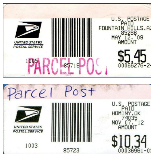
Afbeelding 11: PARCEL POST

Tenslotte de verzending van pakjes. De oude machines printten voor pakjes dezelfde stroken als voor brieven, dus het formaat als in de afbeeldingen 1 en 2 . Soms werd er wel eens een handstempel PARCEL POST of een handgeschreven 'Parcel Post' op de stroken gezet ( afbeelding 11 ).