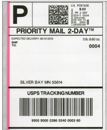
Afbeelding 12: pakketstrook Toshiba