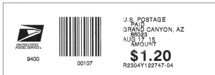
Afbeelding 4: PVI uit 2015

Later bleken er op deze stroken ook een rode eindstreep voor te komen (afbeelding 5), die het eind van de strokenrol aankondigt.