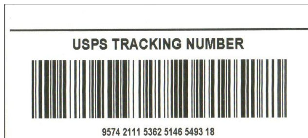
Afbeelding 10: track&trace

Verder geeft de machine voor bestemmingen binnen de USA een track&trace strook af. De reeks cijfers onder de barcode houdt geen verband met de cijferreeks op de loketstrook zelf ( afbeelding 10 ).