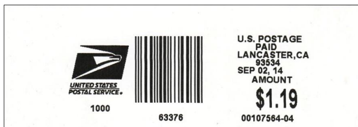
Afbeelding 3: PVI uit 2014

In het najaar van 2014 ontving ik van een kennis een geheel nieuwe strook die in tekst en opdruk leek op de oude stroken, maar die veel breder was en geheel wit ( afbeelding 3 ).